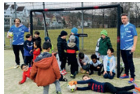
Neue Tore für den Wäldebronner Nachwuchs

Im Februar spendeten die Freunde und Förderer der Fußballjugend des TSV Wäldebronnn-Esslingen e.V. zwei Kleinfeldtore mit den Abmessungen 3 x 2 m, damit die jungen Kickerinnen und Kicker ein noch kindgerechteres Training bekommen! Der Württembergische Fußballverband empfiehlt statt große 5 x 2 m Tore seit dieser Saison die kleineren 3 x 2 m-Tore.