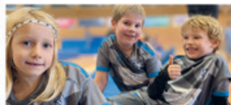
F-Junioren am Hallencup