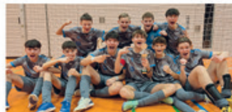
Hallen Turniersieger C-Junioren