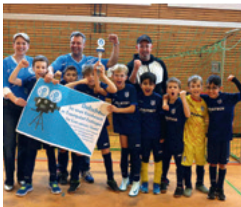
Die erfolgreiche F-Jugend und E-Jugend des TSV Wäldebronnn

Am 4. Dezember durften wir zusammen mit den sehr engagierten Jugendtrainern die Weihnachtsfeier der Bambinis und der F-Jugend feiern. Der Förderverein spendierte 100 Schoko-Nikoläuse sowie Kinderpunsch für die Kickerinnen und Kicker und Glühwein für die Eltern. Über 30 Bambinis und 40 F-Jugend-Spielerinnen und -Spieler freuten sich sehr über die Feier und gegen Ende fand noch ein Spaß-Spiel gegen alle Eltern statt.