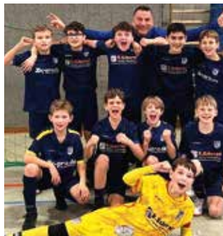
D1 Hallenturniersieger beim RSK und TSVV Hallencup