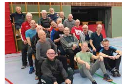
Letztes Training 2025 erfolgreich beendet

Die Radlergruppe strampelt, mit Motor und je nach Wetterlage, nach Möglichkeit an jedem 4. Dienstag im Monat durchs Ländle, über Stock, Stein, Matsch und zwischendurch über sehr, sehr schmale Bachbrücken in einsamen Naturschutzgebieten. Diese Abenteurer initiieren im Wechsel, da ohne Häuptling, sechs Routen, so dass abwechslungsreiche Überraschungstrecken, nach dem Motto, da muss MANN durch, bewältigt werden.