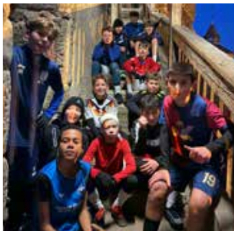
D-Jugend Lauftraining Burgstaffeln